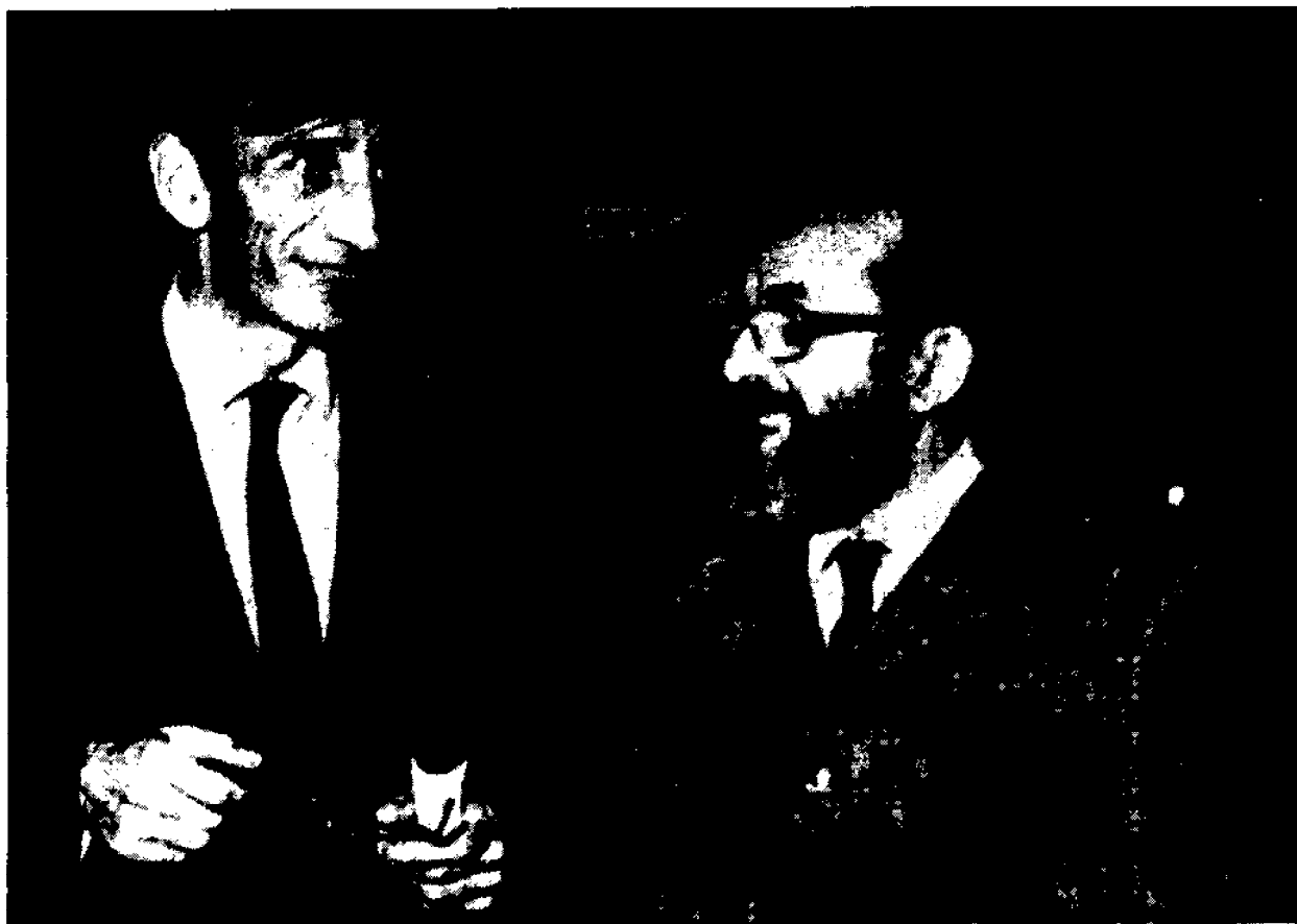
Paulo Freire accanto a Ivan Illich a Ginevra, 1971.

questo, il primo passo è la “coscientizzazione” e, di conseguenza, è molto importante la formazione dell’educatore.