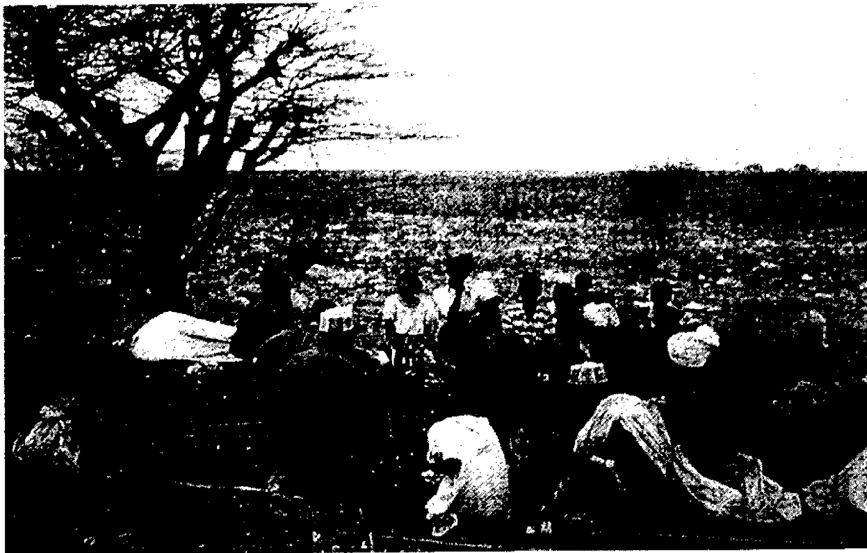
Questa foto è stata inviata nel 1986 a Paulo Freire da un suo lettore, un educatore che applica le sue idee in circa 80 classi di popoli nomadi del deserto del Kenya.

Il lettore non deve cercare qui ricette magiche che lo aiutino ad ottenere meccanicamente risultati migliori nella sua pratica pedagogica. Non abbiamo nemmeno trascurato l'analisi delle proposte concrete che costituiscono parte integrante della filosofia educativa di Paulo Freire. La ricca esperienza e l'analisi teorica di questo educatore, formatesi in varie parti del mondo, ci aiuteranno certamente a comprendere i contesti, necessariamente diversi, nei quali agiamo, e ciò renderà il nostro intervento più efficace ed obiettivo.