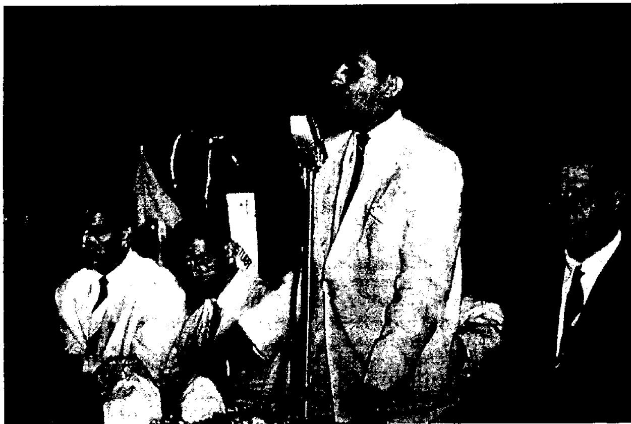
Paulo Freire a Recife, negli anni '50 in qualità di Direttore del Dipartimento dell'Educazione del SESI (Servizio Sociale dell'Industria).

fu qui, proprio qui, che la realtà gli si rivelò. Fu qui che Freire imparò a dialogare con la classe lavoratrice, a comprendere il modo in cui questa apprendeva il mondo e il suo linguaggio. Fu qui che, apprendendo nella pratica, divenne un educatore. E fu così che imparò qualcosa da cui non si sarebbe mai più allontanato: a pensare partendo sempre dalla pratica .