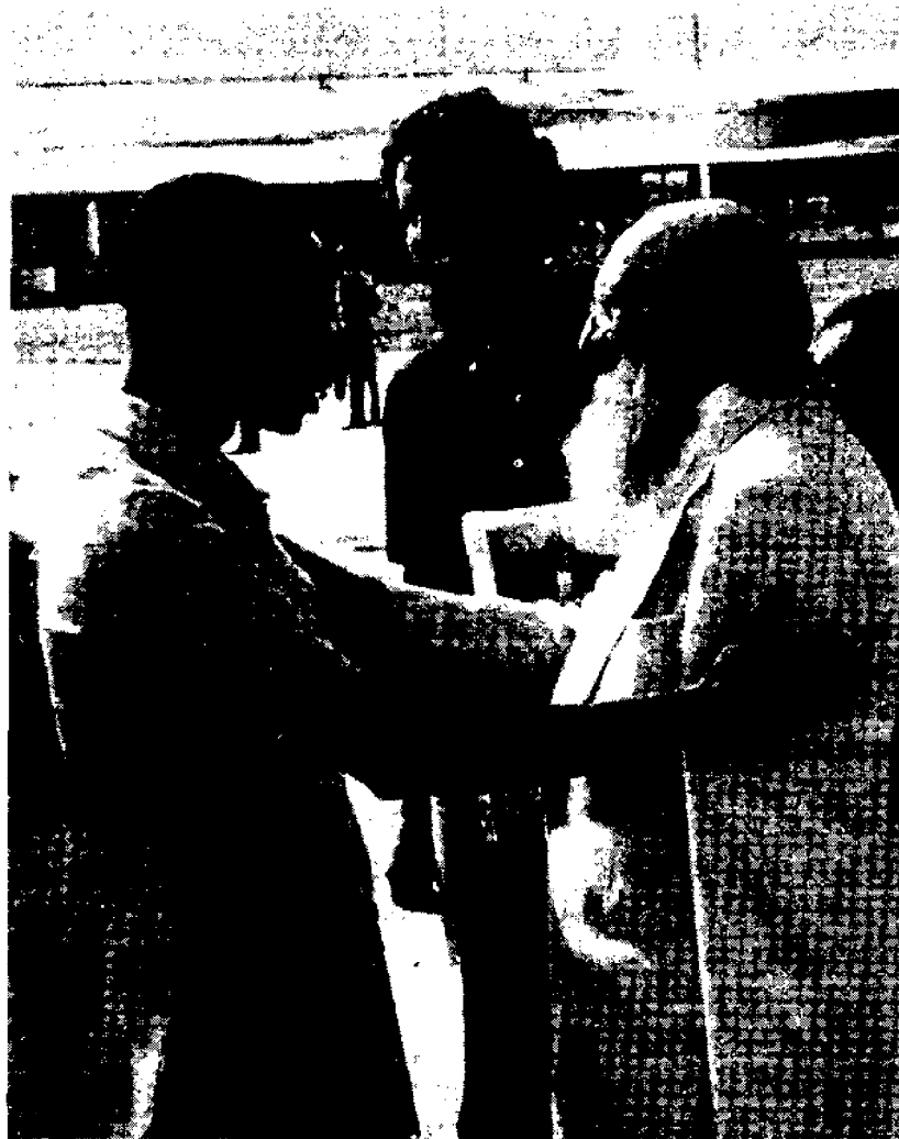
Paulo Freire accanto a Miguel Darcy de Oliveira, dell'IDAC, e Mário Cabral, ministro della Pubblica Istruzione della Repubblica della Guinea-Bissau, nel 1978.

diversi. Le lettere che l'IDAC inviava ad Amílcar Cabral 12 impiegavano molto tempo prima di ricevere una risposta, a causa della guerra, e in questi intervalli di tempo, il personale dell'IDAC ne approfittava per leggere i testi di Amílcar Cabral.