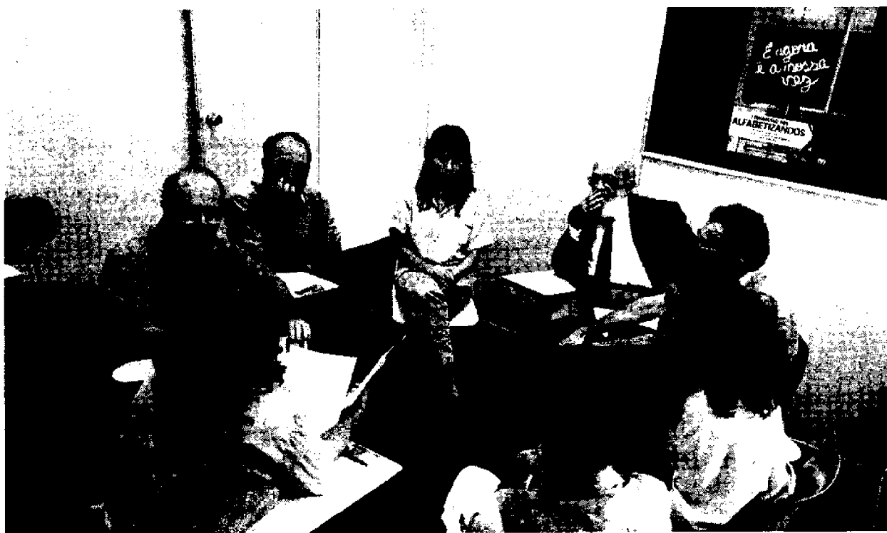
Paulo Freire, come assessore all'Educatione, coordina il gruppo del primo Convegno di alfabetizzazione dei Giovani e Adulti del MOVA-SP, nella città di San Paolo, nel 1990.

I movimenti popolari di alfabetizzazione e post-alfabetizzazione vivevano all'epoca serie difficoltà nel proseguimento del lavoro, dato l'aggravamento della crisi economica nel paese e l'abolizione dei diversi progetti che si realizzavano con i fondi della "Fondazione Educare".