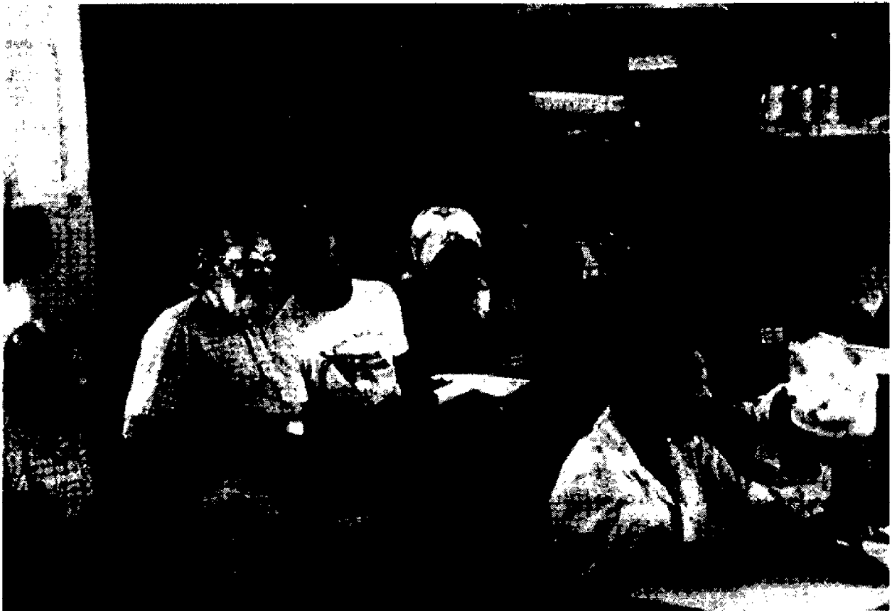
Il primo Seminario Nazionale sull'Alfabetizzazione, Monte Mário, Repubblica Democratica di São Tomé e Príncipe, 1976.

un principio neocolonialista che l'IDAC rifiutava in modo perentorio, in base al quale le esperienze non si trapiantano, si vivono.